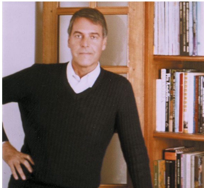
Lucio Saffaro, che si era laureato in Fisica all'Università di Bologna, è morto nel 1998

Anche se il testo di Saffaro, in apparenza, contiene in sé le caratteristiche della narrazione, perché c'è una storia, dei