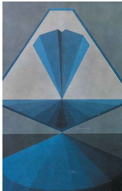
"Il grande ritratto di Plotino" di Lucio Saffaro