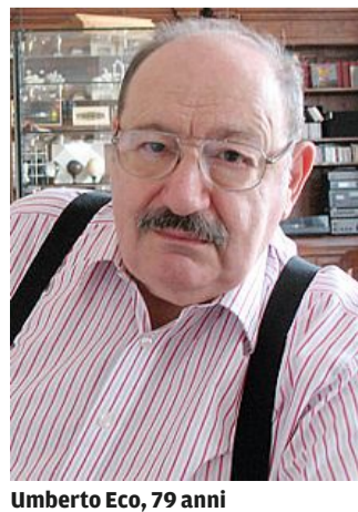
Umberto Eco, 79 anni

è né particolarmente avvincente, né divertente. Come opera storica risente di un errore strutturale». Il giornale conclude che Umberto Eco «voleva sempre essere uno scrittore illuminista, questa volta se l'è presa comoda». Altrettanto impietoso il giudizio del conservatore "Frankfurter Allgemeine Zeitung", in cui si spiega che il nuovo libro di Eco è «un romanzo fallito», poiché «dopo 300 pagine non si tratta più di un romanzo, ma di uno schedario di persone, mappe stradali e bibliografia, un enorme apparato di note che è scivolato nel testo».